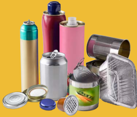
EMBALLAGES MÉTALLIQUES, MÊME LES PLUS PETITS